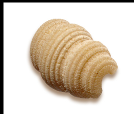
Nuvole rigate N°s103 semi-complets