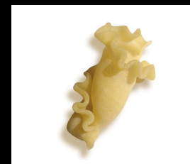
Campanelle N°252 blanches