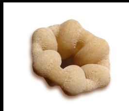
Fiori N°s106 demi-complets