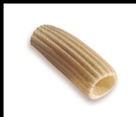
Macaroni rigate N°79 demi-complets