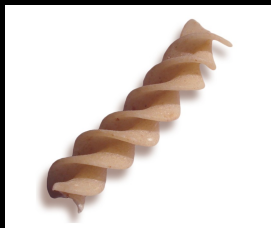
Fusilli N°240 au petit épeautre