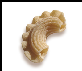
Creste rigate N°145 demi-complets