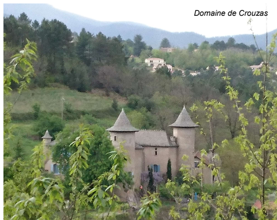
Domaine de Couzas

Même si elle a marqué le pas du fait de la priorité donnée à faire émerger les valeurs et objectifs communs du groupe, la recherche d'un lieu se poursuit.